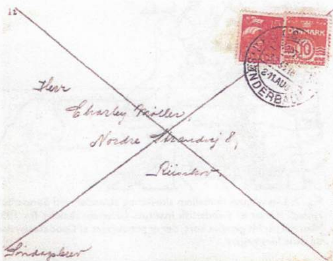
Fig. 9: Søndagsbrev sendt fra landslejren 3. 8. 35 18-. Tillægget for søndagsbreve var i 1935 10 øre. Søndagspost indførtes i 1929 og afskaffedes i 1972. Søndagsbreve er især fødselsdagshilsner. Jeg kender kun dette ene søndagsbrev sendt fra en spejderlejr, men der må kunne findes flere.