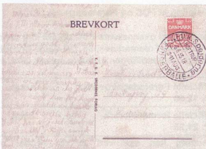
Fig. 8: Brevkort fra KFUK-spejdernes landslejr stemplet 6. 8. 35 18-. Allerede fra første lejrdrag er der noget galt med stemplet, så der ikke vises en tidsperiode, som man brugte til omkring 1947. Stemplet findes med tidsangivelse 9- og 18-.

Hvis man er interesseret i hvor flittige spejdere var til at skrive breve, kan man regne sig frem til at hver KFUM-spejder i gennemsnit har sendt lidt over 3 breve. Hver DDS'er har sendt 2½