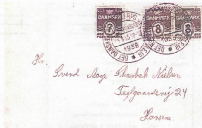
Fig. 4: Konvolut frankeret med 23 øre sendt fra Det Danske Spejderkorps Jubilæumslejr 4. 8. 35 10-16. Brevet ser absolut ud til at være sendt af en ung spejder. Det er antageligt en fejl, at frankeringen er 23 øre i stedet for 15 øre. Stemplet kendes med mange forskellige tidsangivelser. 6-7, 7-10, 10-16, 10-17, 10-18, 12-18 og på den sidste dag stempledtes der 6-7 og 10-14.

Som en Foranstaltning, der vil være meget gavnlige, vil jeg bestemt foreslaa, at Depotudsalget faar Salg af de almindelige gængse Frimærkeværdier, saa Drengene kan købe disse sammen med Postkortene eller Brevpapir og Konvolutter, særligt i de urolige Tider paa Dagen vil det være en Fordel.