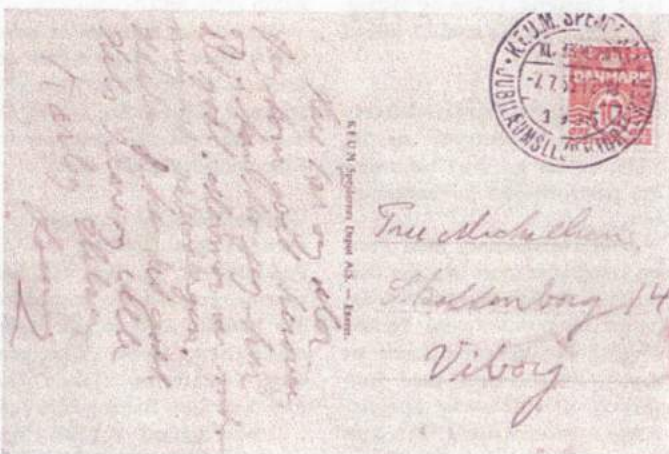
Fig. 3: Postkort sendt fra lejren 7. 7. 35 12-18. Kortet er sendt af et barn, der med sin mormor besøgte lejren.