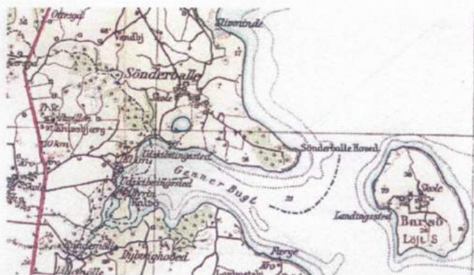
Fig. 7: Landslejren lå mellem skoven og stranden ved Sønderballe Hoved. Kortet er Geodætisk Instituts Generalstabskort fra 1933. Man må nu frit gengive kort, der er produceret af Geodatastyrelsen og dens forgængere.

Thisted, Fredericia og Odense. I 1932 kom han til København. I 1940 blev han postmester i Brobyværk på Fyn og i 1958 postmester i Bramminge. Han pensioneredes i 1968 og flyttede så til Bornholm. Jeg har ikke fundet informationer, om han har været medlem af et af spejderkorpsene.