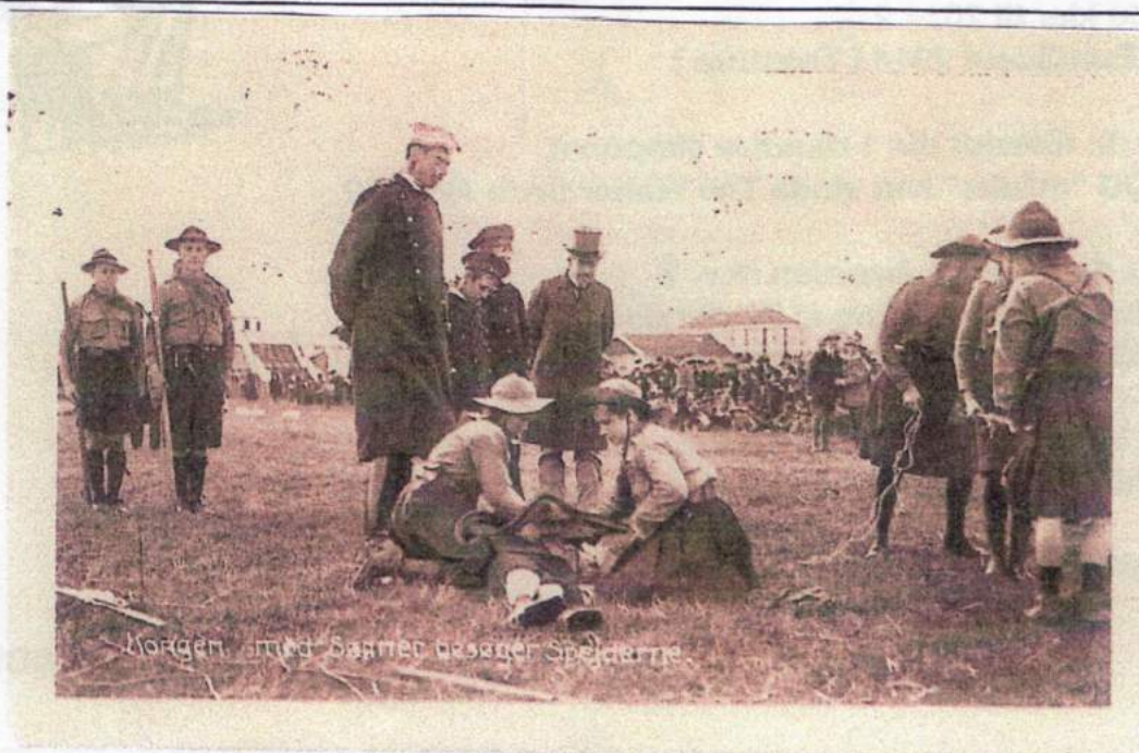
Kongen med Sønner besøger Spejderne, "Kløvermarken", 1912.

Udgivet af Spejderfrimærkeklubben i Danmark