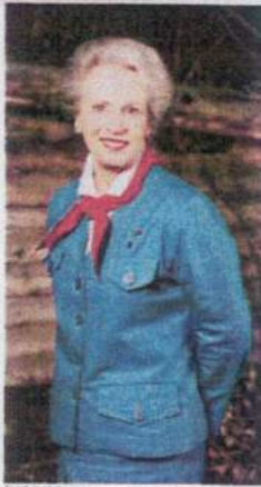
PRINSESSE BENEDIKTE 70 ÅR