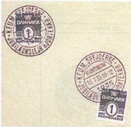
Fig. 2: 1 øres frimærker på side fra notesblok stemplet sidste lejr dag 15. 7. 35 10-12. Fra de øvrige lejr dage findes stemplet med tidsangivelserne 12-17 og 12-18 varierende for de enkelte dage.

over Lejrdeltagerne. Arbejdsforholdene var ret haarde. Med de nødvendige Spisepauser var Postkontoret faktisk i arbejde fra Kl. 7 Morgen til Kl. 20 Aften.