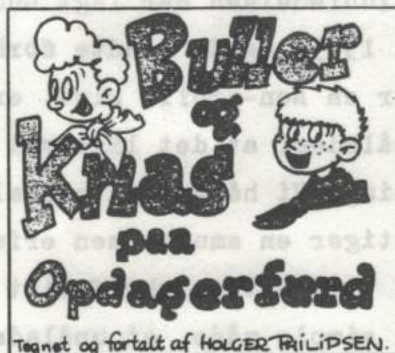
Buller og Knas var på ferie i Viborg, og en dag var de ude på heden ved Daugbjerg Daas.

Altså en dejlig julegave i 83, og en god opgave at arbejde med i 1984 - sikke en start på en ny sæson - tak for den gamle