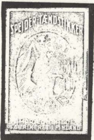
alm. æske fra Finland ←