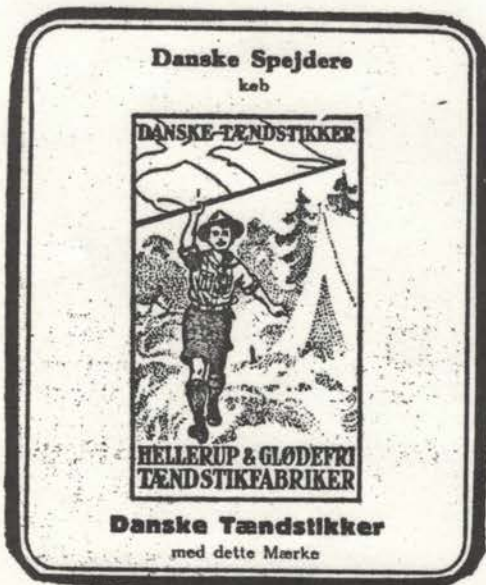
annonce fra Sp. Magasin ↑ etikette fra husholdningsæske Danmark →