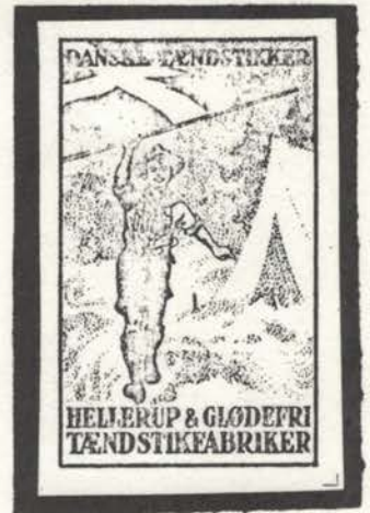
alm. æske fra Danmark →